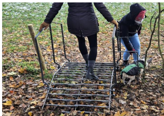
passage au sol pour le chien qui ne franchit pas la