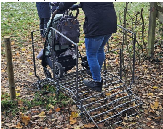
Passage avec une poussette rampe.

Rampe complète ne nécessitant pas de béton mais un système d'ancrage au sol facile à enfoncer